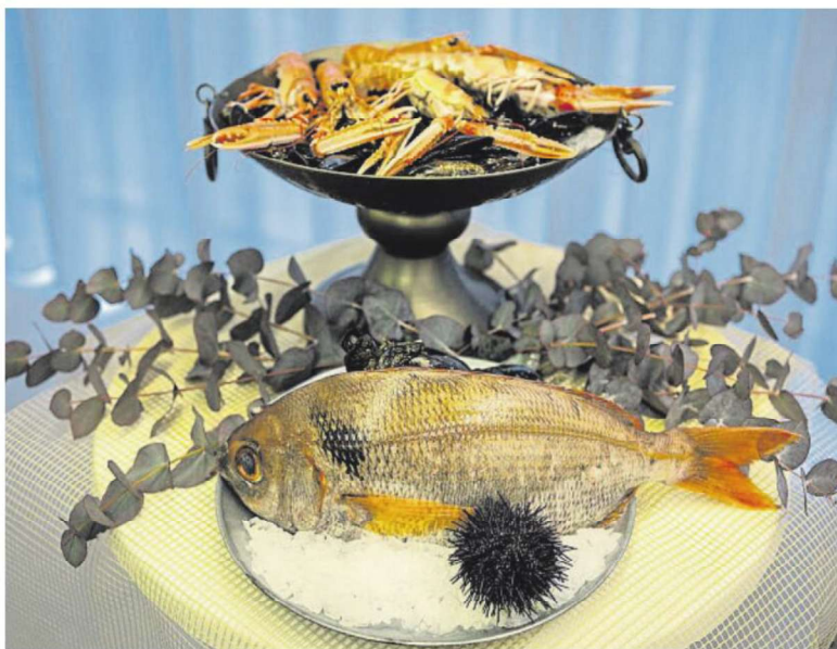
El pescado viene experimentando una subida de su valor a lo largo del año

Ahora bien, en este sector siempre se está muy pendiente de las