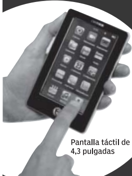
Pantalla táctil de 4,3 pulgadas

*Promoción válida hasta el 5 de enero de 2012