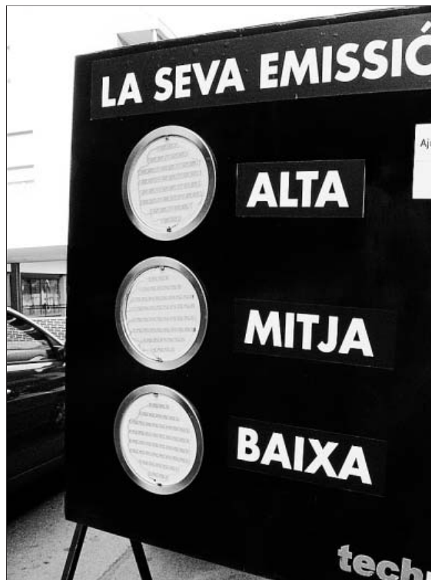
El punto de control de emisiones, ayer, en Granollers.

instantánea las emisiones contaminantes de los tubos de escape. Un semáforo indica al conductor si la emisión es alta (rojo), mediana (naranja) o baja (verde). El objetivo es hacer estos controles en Barcelona y 40 municipios