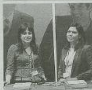
«Creamos la solución que ellos nos están esperando y la futura.»