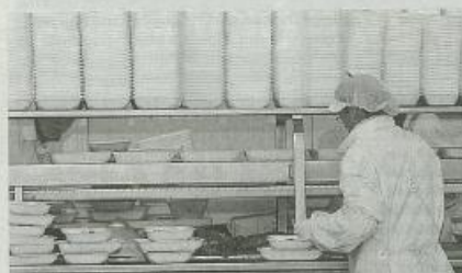
Empresa del sector càrnic present en Mercabarna. ASSOCOME