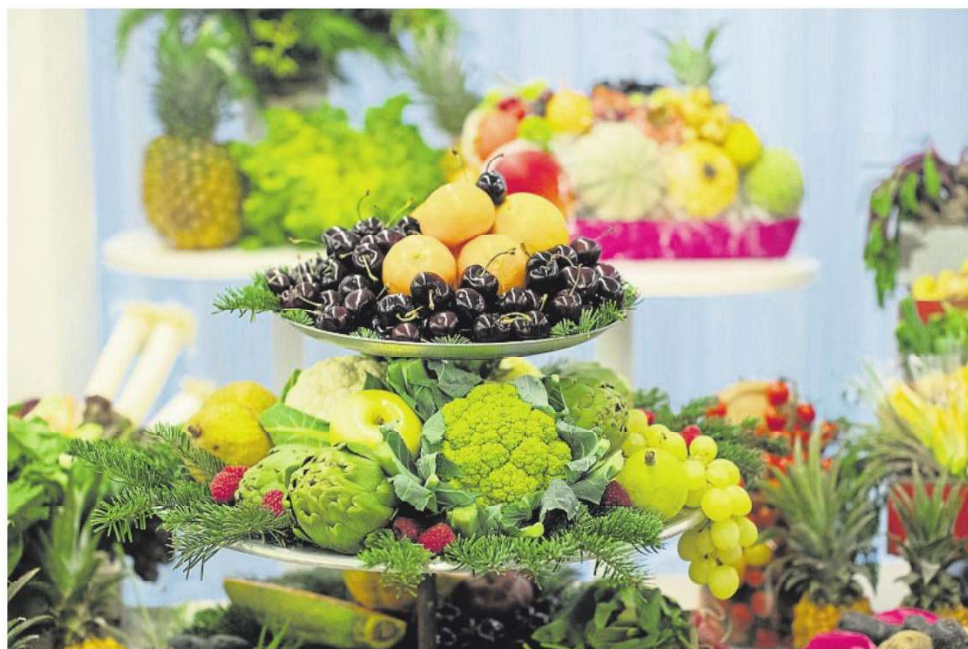
Cesta con frutas y verduras ayer en la presentación de la campaña de Navidad de Mercabarna

Los mayoristas prevén, no obstante, que se frenará la escalada general de precios