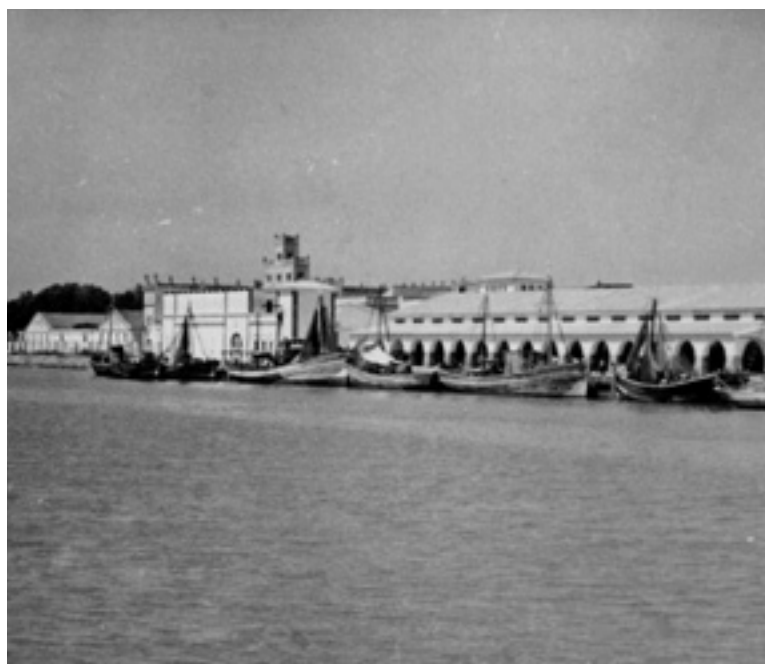
PUERTO DE CÁDIZ. Imagen histórica del puerto de la Bahía de Cádiz.